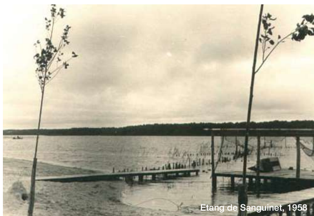
Etang de Sanguinet, 1958