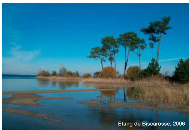
Etang de Biscarosse, 2006

C e site correspond à des espaces qui subissent des pressions fortes. En effet, les étangs landais subissent les inconvénients de leur succès : l'urbanisation s'étend fortement et les milieux naturels reculent. La pression à proximité des rives et des zones naturelles telles que ruisseaux, zones humides et leur